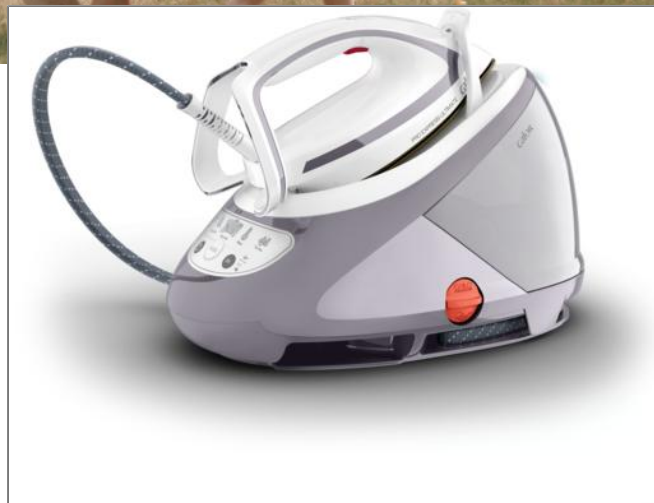
PRO EXPRESS ULTIMATE GV9555C0 GV9555C0